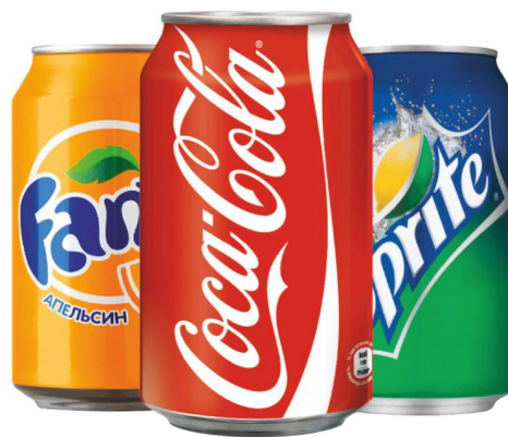
Кока-Кола, Спрайт, Фанта Coca-Cola, Sprite, Fanta 150₽ / 330 ml

Мы рады приветствовать Вас на борту и предлагаем Вам обновленное меню. Нам важно мнение наших пассажиров, именно поэтому теперь Вы можете заказать расширенный перечень товаров Sky Bistro, а также приобрести товары и сеты по выгодной цене.