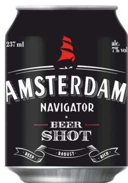
Пиво «Амстердам» «Amsterdam» Beer 200₽ / 237 ml