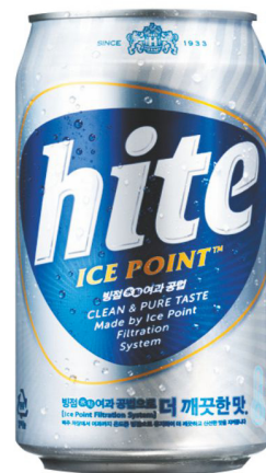
Пиво «Hite» «Hite» Beer 250₽ / 330 ml