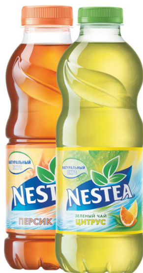
Чай «Nestea» в ассортименте «Nestea» tea In assortment 150₽ / 500 ml